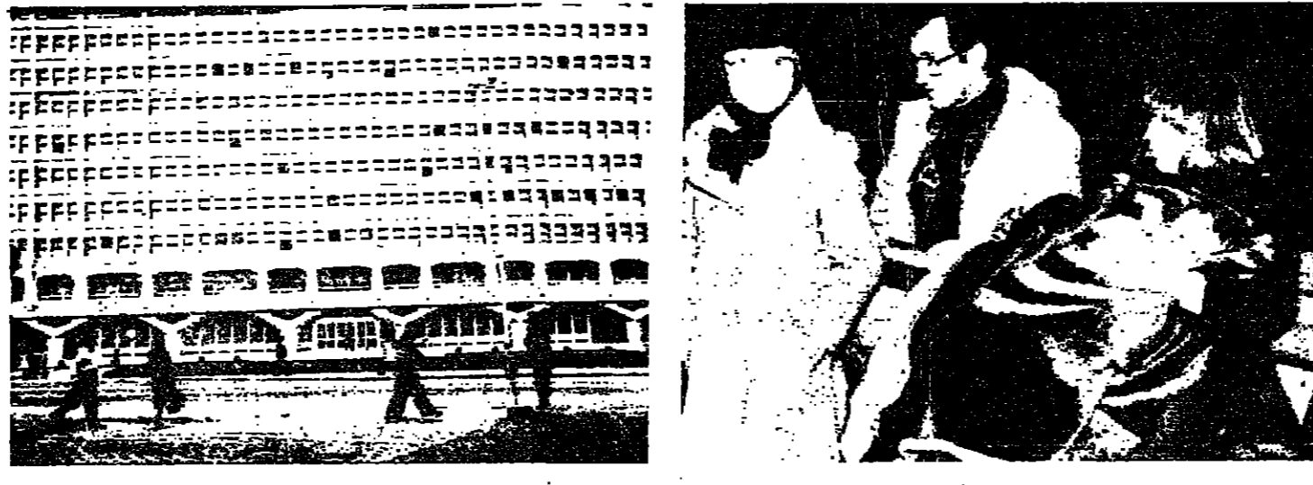
عائلة يوغوسلافية خرجت الى العراء بعد الزلازل

الاصحاب بالمسؤولين الرومانيين الا ان نطاق التدمير الحكومي واللجوء التي تصاحبه بها البيئات الريفية ويوجد بان رومانيا تواجه كارثة كبيرة. ومن الممكن ان يكون قد قتل عدد من الناس يبلغ المئات عندما اصابت الزلازل مناطق ترانسلفانيا ذات الكثافة السكانية الشديدة والواقعة الى الشمال من بوخارست ومنها ايضا اضرار بالغة في العاصمة التي يبلغ عدد سكانها 1.6 مليون نسمة. واعلنت مجلة التايم في العدد الصادر باسم الرئيس نيكولاي تشاوشيسكو الذي كان في لاغوس في نيجيريا يختم جولة في خمسة بلدان افريقية عند حدود الزلازل.